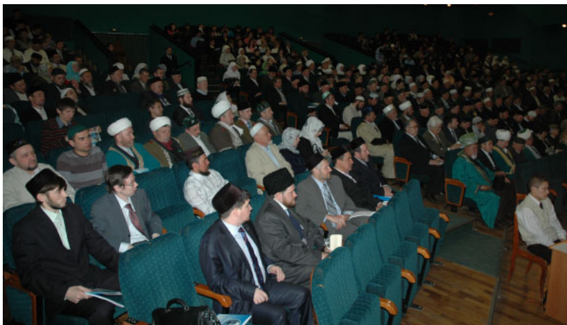
Участники I Всероссийской научно-практической конференции «Фахретдиновские чтения» (Уфа, 7 апреля 2009 г.)