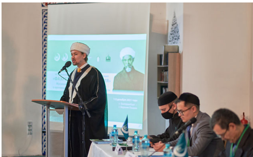
VIII Всероссийская научно-практическая конференция «Фохретдиновские чтения». Пленарное заседание. Выступление имама-мухтасиба Артура Мухутдинова, председателя Уральского Мухтасибата в составе ДУМ РФ (Екатеринбург, 1–3 декабря 2021 г.)