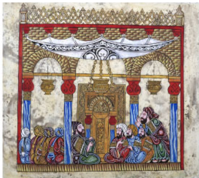
Рис. 2. Сопоставление иллюстрации к макаме № 98 и иллюстрации «Рождение Хусаина Фаизханова»