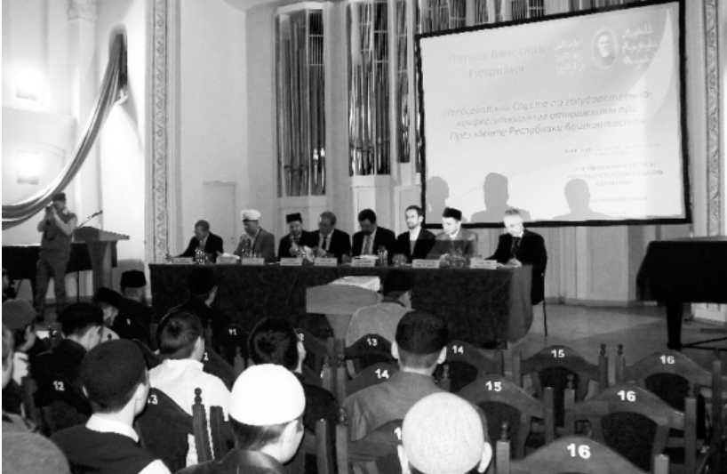
II Всероссийская научно-практическая конференция «Фахретдиновские чтения» (Уфа, 5 апреля 2011 г.)