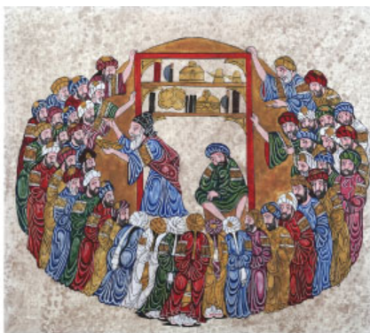
Рис. 3. Сопоставление иллюстрации к макаме № 94 и иллюстрации «Хусаин Фаизханов на занятиях у Марджани. 1-я мечеть»