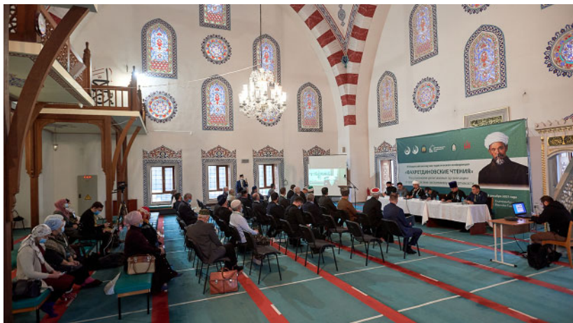
VIII Всероссийская научно-практическая конференция «Фахретдиновские чтения» (Екатеринбург, 1–3 декабря 2021 г.)