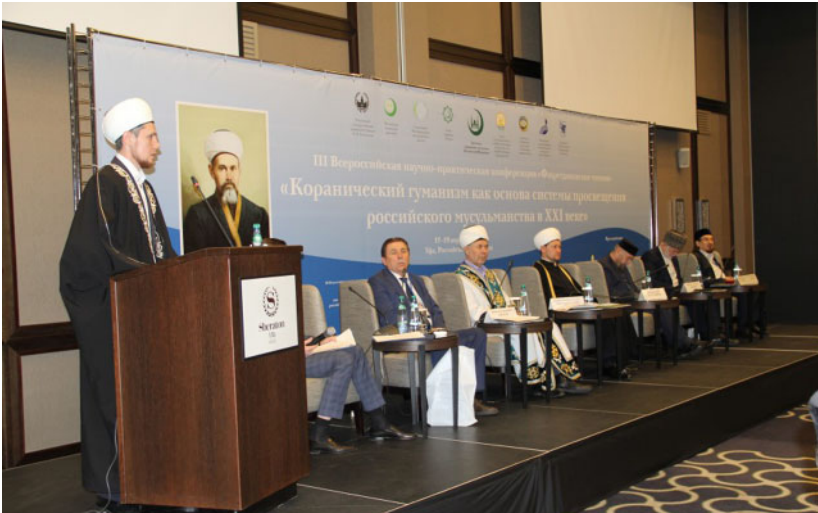
Президиум III Всероссийской научно-практической конференции «Фахретдиновские чтения» (Уфа, 17–19 апреля 2016 г.)