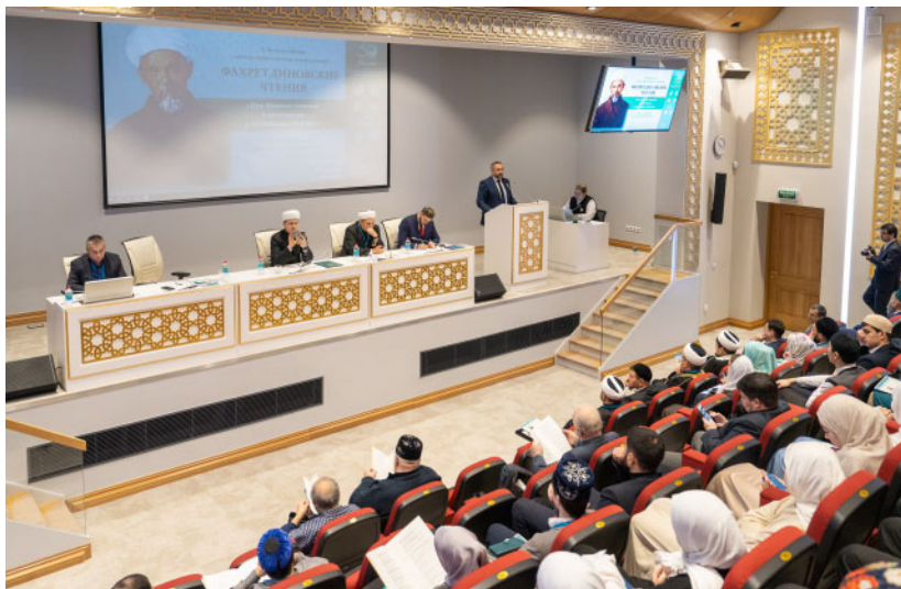
X Всероссийская научно-практическая конференция «Фохретдиновские чтения». Конференц-зал Московской Соборной мечети (Москва, 2–4 декабря 2024 г.)