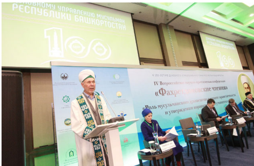
IV Всероссийская научно-практическая конференция «Фохретдиновские чтения». Пленарное заседание (Уфа, 14–16 ноября 2017 г.). На фото: Нурмухамет Нигматуллин (слева), муфтий Башкортостана (1992–2019)