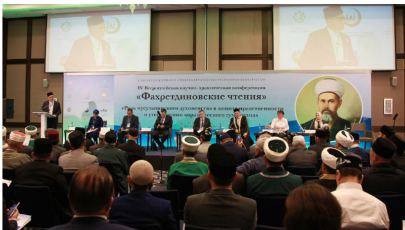
IV Всероссийская научно-практическая конференция «Фохретдиновские чтения». Пленарное заседание (Уфа, 14–16 ноября 2017 г.)