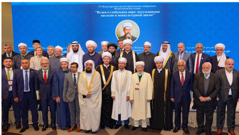
Участники VI Международной научно-практической конференции «Фохретдиновские чтения» (Москва, 24 сентября 2019 г.)