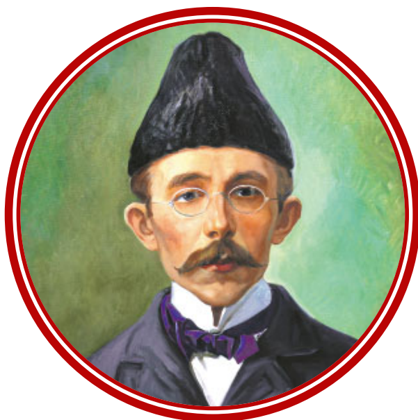
Муса Жаруллаһ Бигиев 1875–1949