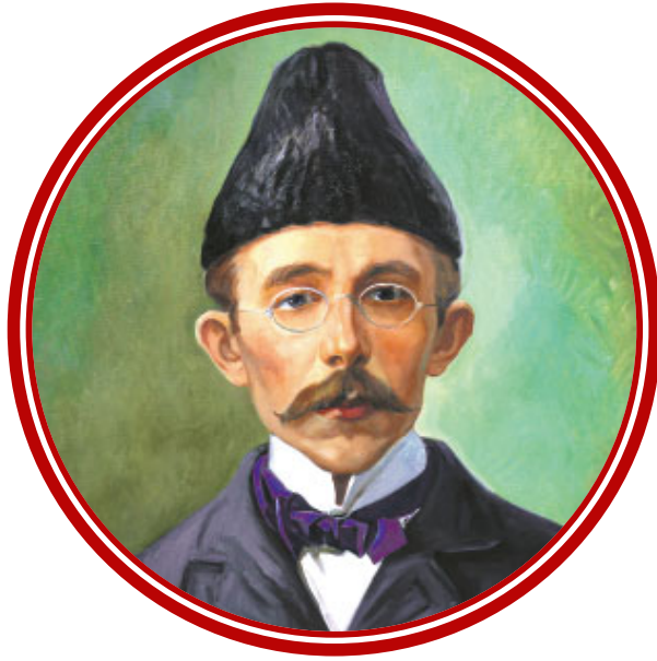
موسی جار الله بیگئیف 1875-1949