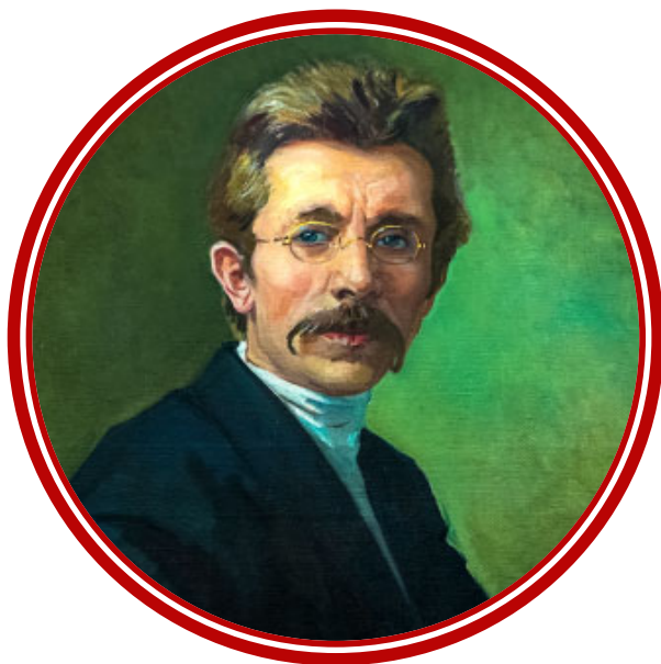
Муса Бигиев (1875–1949)