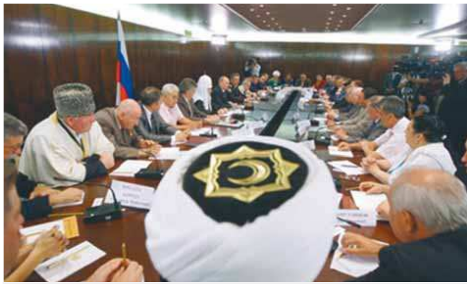
„Россия — наша Родина“, — муфтий Равиль Гайнутдин

Мы и назвали его Общероссийский народный фронт, подчеркивая, что каждый человек в нашей стране может быть представителем любой конфессии, представителем любой этнической группы, но он в то же самое время должен осознавать, что он часть единой, многонациональной российской нации и гражданин Российской Федерации, и нести это звание с гордостью».