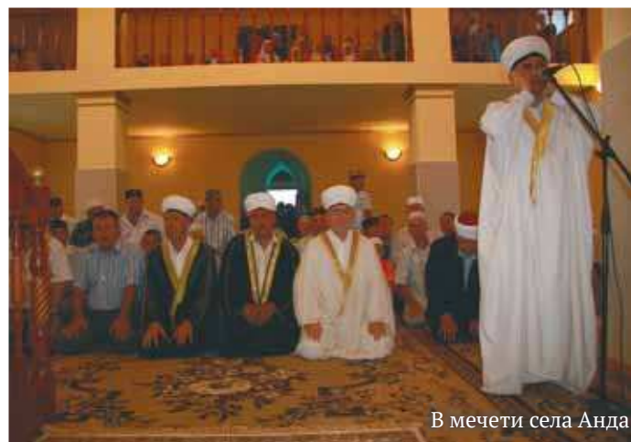
В мечети села Анда