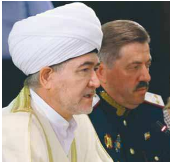
Равиль Гайнутдин на встрече премьер-министра РФ Владимира Путина с представителями религиозных и общественных организаций 19 июля 2011 г. в Москве

«Мы живем в многонациональном, многоконфессиональном государстве. Наше государство, возможно, похоже на некоторые другие государства — такие же многонациональные и многоконфессиональные, но... имеет свою особенность. Мы являемся не пришельцами в свою страну — мы являемся коренными гражданами своего Отечества. Мы имеем здесь могилы своих отцов и дедов, мы имеем и общую историю. Мы вместе создавали наше государство, мы вместе защищали интересы своего Отечества и сегодня мы заботимся о благополучии и процветании нашего Отечества.