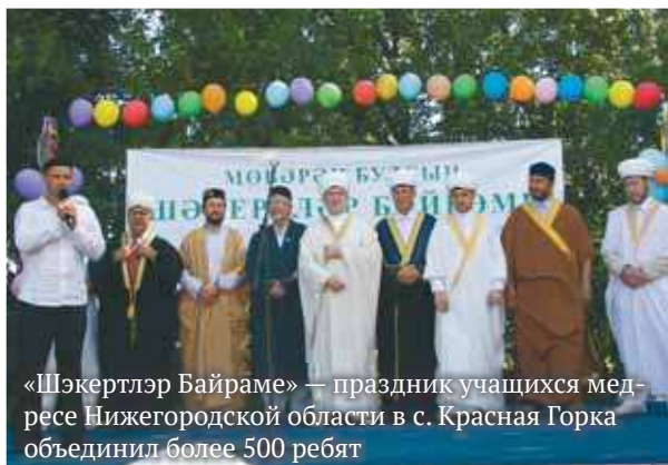
«Шэкртлэр Байраме» — праздник учащихся медресе Нижегородской области в с. Красная Горка объединил более 500 ребят