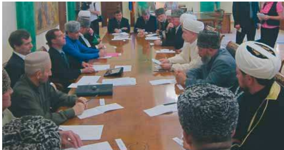
„Мы помогли и будем помогать российским мусульманам“, — Президент России

Мы должны исходить из консолидированной солидарной позиции всех граждан нашей страны, а также поддержке мирового сообщества, в том числе сообщества мусульманских государств. Развитие дружественных связей Российской Федерации с исламским миром остается приоритетом нашего государства. Мы должны это делать и должны заниматься развитием таких связей с наиболее авторитетными, ключевыми международными организациями исламского мира. Конечно же, мы традиционно помогали и будем помогать российским мусульманам в вопросах осуществления хаджа».