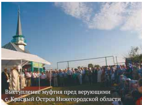
Выступление муфтия пред верующими с. Красный Остров Нижегородской области

Делегация СМР и ДУМЕР посетила село Малое Рыбушкино и сельскую мечеть, отметившую 150-летний юбилей. Она известна тем, что