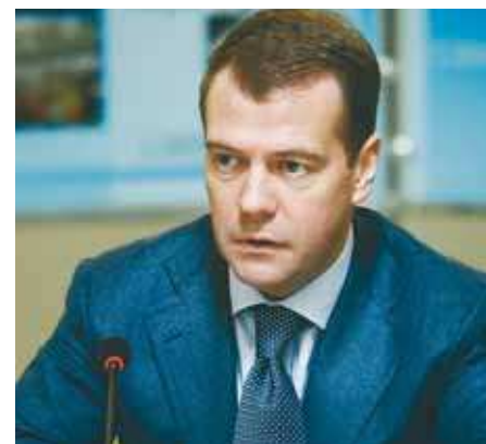
„Российское государство ценит работу муфтиев“, — Дмитрий Медведев

Значительная часть ответственности за возврат тех, кто «заблудился» и в то же время не совершил тягчайших преступлений, лежит на государстве, представителях региональной власти и мусульманской общине. Мне кажется, что если мы будем так последовательно действовать, то эта цель, несмотря на то, что она сложная, вполне достижима, потому что человечество всегда находило в себе силы справляться с большим количеством проблем и угроз.