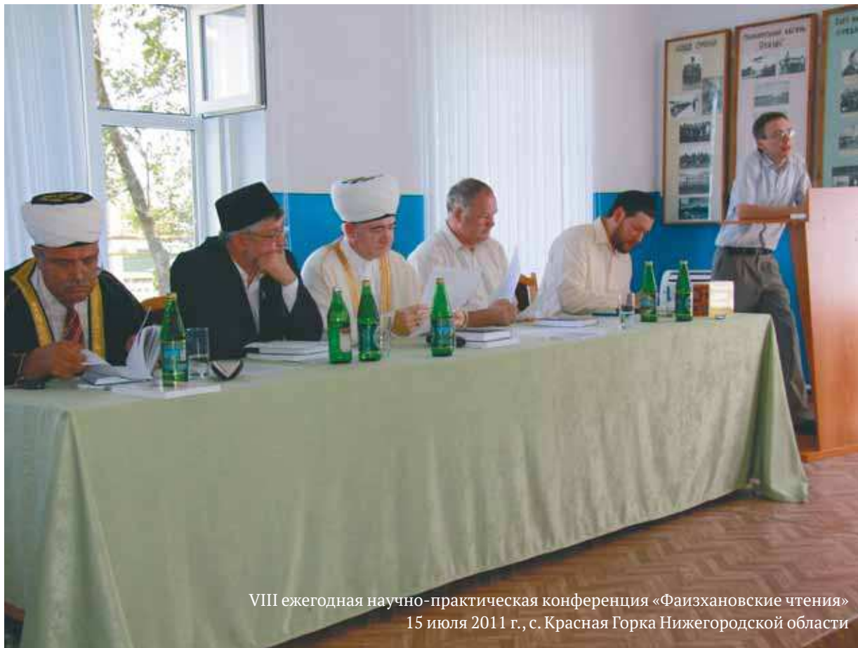
VIII ежегодная научно-практическая конференция «Фаизхановские чтения» 15 июля 2011 г., с. Красная Горка Нижегородской области

Делегация направилась в село Сафаджай — Красная Горка и первым объектом посещения стало историческое место, где в 1451 году было заложено это поселение предками современных нижегородских татар. Ныне Сафаджай — самое древнее и самое крупное село в Нижегородской области. Сегодня в нем проживает более 2500 человек и действует пять мечетей. В этом памятном месте несколько лет назад установлена стела в виде черной гранитной плиты с высеченными на ней именами — памяти всех