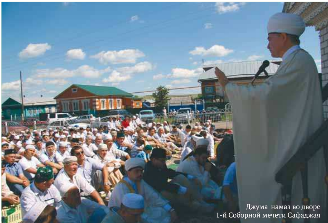
Джума-намаз во дворе 1-й Соборной мечети Сафаджая