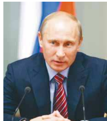
„Решение межнациональных отношений является особенно важным“, — Владимир Путин

Именно поэтому и та площадка, на которой мы с вами собрались, Общероссийский народный фронт, задумывалась именно как платформа, на которой могли бы собираться люди самых разных конфес-