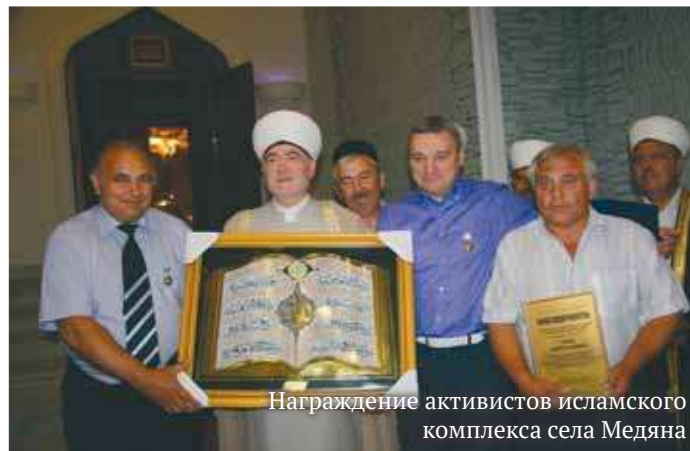
Награждение активистов исламского комплекса села Медяна