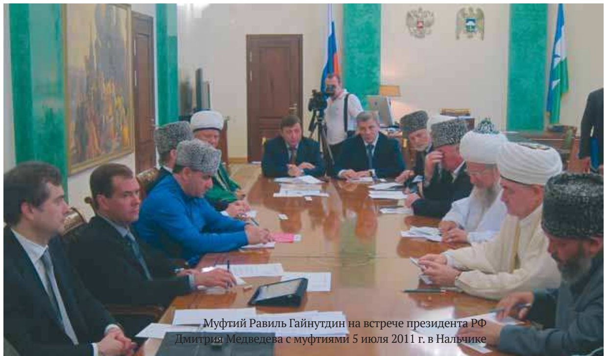
Муфтий Равиль Гайнутдин на встрече президента РФ Дмитрия Медведева с муфтиями 5 июля 2011 г. в Нальчике

Российское мусульманское сообщество озабочено вызовами, стоящими перед нашей страной