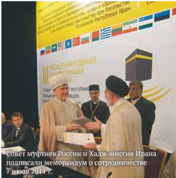
Совет муфтиев России и Хадж-миссия Ирана подписали меморандум о сотрудничестве 7 июля 2011 г.

— создать Центральный паломнический центр в Москве при Совете муфтиев России, а также филиалы при Духовных управлениях для более скоординированной и продуктивной деятельности; — продолжать сотрудничество с соответствующими государственными органами и другими организациями по усовершенствованию паломничества;