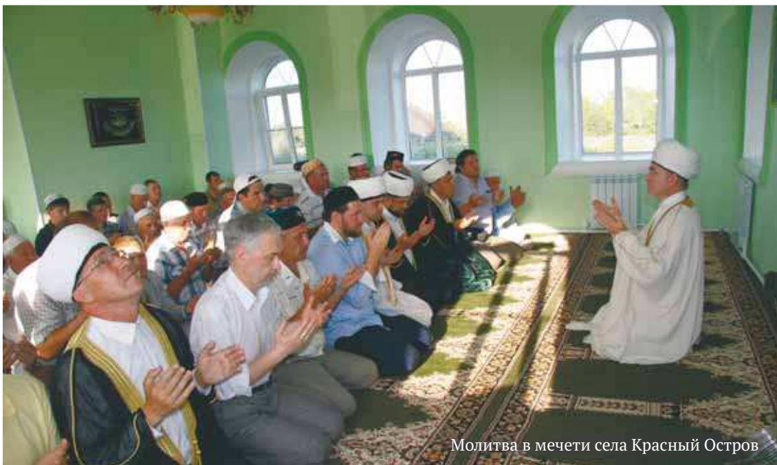
Молитва в мечети села Красный Остров