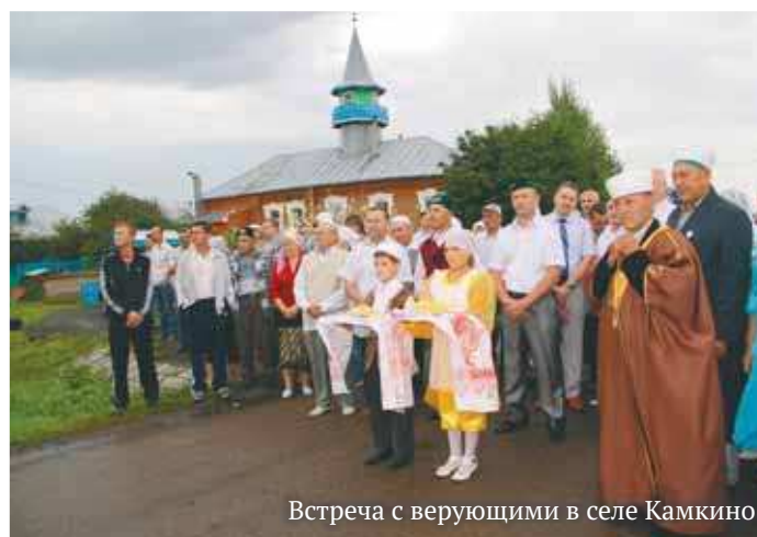
Встреча с верующими в селе Камкино