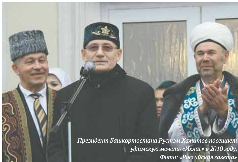
Президент Башкортостана Рустэм Хамитов посещает уфимскую мечеть «Ихлас» в 2010 году.

Это может показаться парадоксальным, но московские «гас-