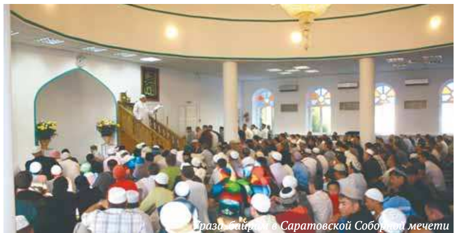
Ураза-байрам в Саратовской Соборной мечети