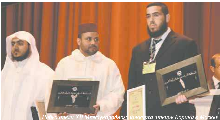
Победители XII Международного конкурса чтецов Корана в Москве