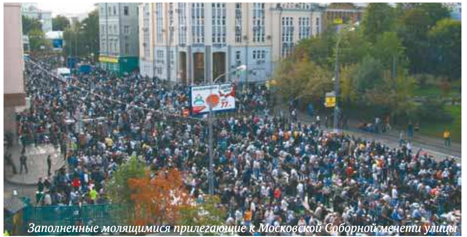
Заполненные молящимися прилегающие к Московской Соборной мечети улицы