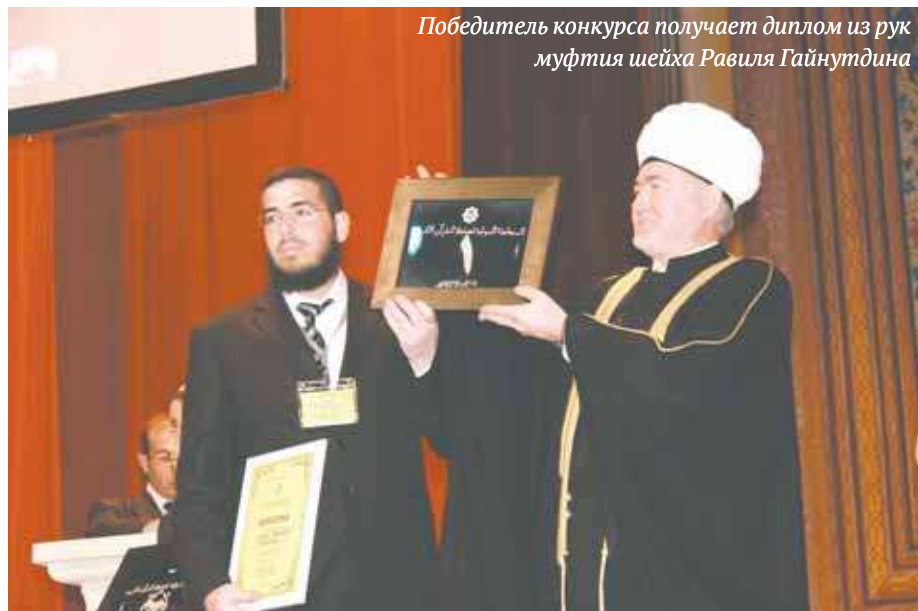
Победитель конкурса получает диплом из рук муфтия шейха Равиля Гайнутдина