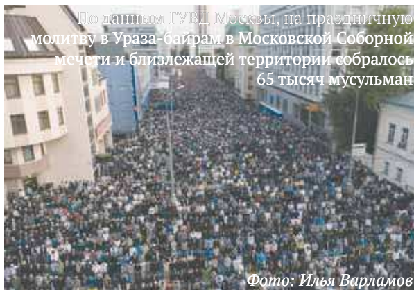
По данным ГУВД Москвы, на праздничную молитву в Ураза-байрам в Московской Соборной мечети и близлежащей территории собралось 65 тысяч мусульман