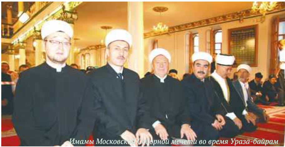
Имамы Московской Соборной мечети во время Ураза-байрам