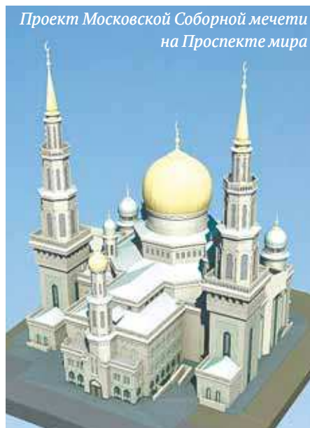
Проект Московской Соборной мечети на Проспекте мира

Первый заместитель председателя Духовного управления мусульман Европейской части России