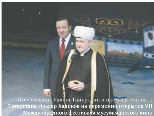
Муфтий шейх Равиль Гайнутдин и премьер-министр Татарстана Ильдар Халиков на церемонии открытия VII Международного фестиваля мусульманского кино