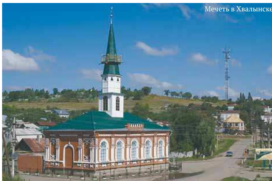
Мечеть в Хвалынске

Интересна судьба такого поселения, как Мечетная слобода. Этот населенный пункт на реке Большой Иргиз был основан после издания манифеста от 4 декабря 1762 года, в котором Екатерина II призывает старообрядцев поселиться на данных землях. Однако очевидно, что к этому времени на его месте уже существовало тюрко-мусульманское поселение, которое получило свое название от развалин мечетей, существовавших здесь в период Золотой Орды. В 1836 году Мечетная слобода была переименована в город Николаевск — центр Николаевского уезда Самарской губернии (ныне город Пугачев Саратовской области). Собственно Мечетная слобода располагалась в четверти вер-