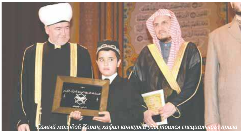
Самый молодой Коран-хафиз конкурса удостоился специального приза