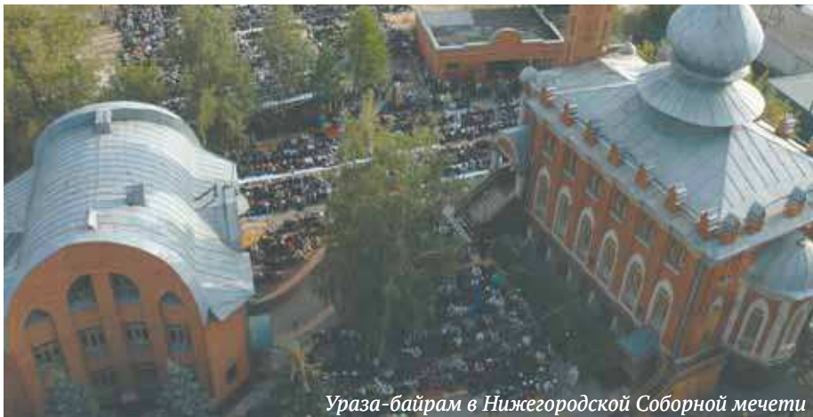
Ураза-байрам в Нижегородской Соборной мечети