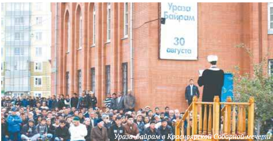
Ураза-байрам в Красноярской Соборной мечети