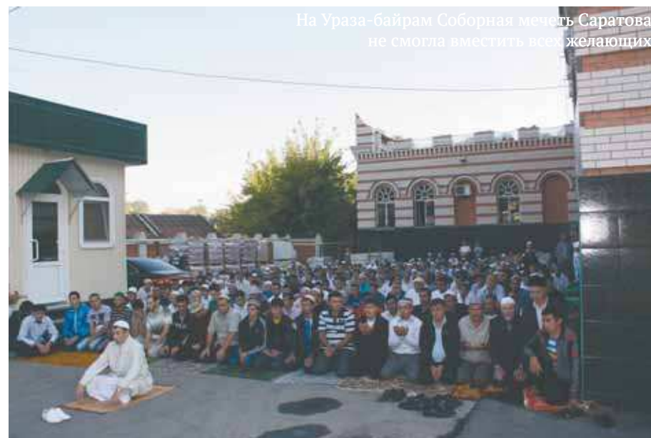
На Ураза-байрам Соборная мечеть Саратова не смогла вместить всех желающих

Необходимо сказать, что Духовное управление мусульман Саратовской области (ДУМСО) — единственная централизованная мусульманская организация в регионе и она сумела сработаться со всеми этническими группами. На протяжении почти 20 лет своего существования