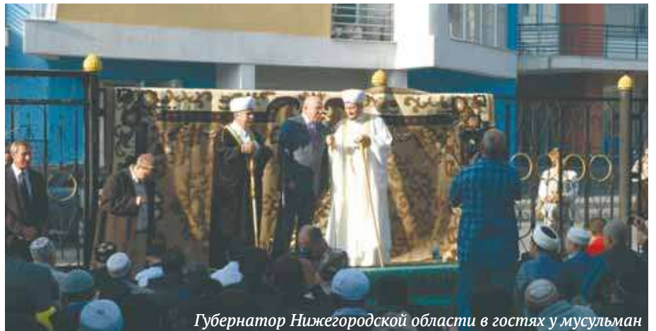
Губернатор Нижегородской области в гостях у мусульман