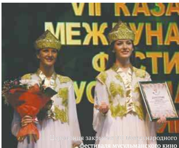
Церемония закрытия VII Международного фестиваля мусульманского кино

На церемонии открытия президент фестиваля муфтий шейх Равиль Гайнутдин отметил, что «фестиваль призван распространять между народами, культурами и традициями любовь, братство, мир, согласие и реализовать все гуманистические признаки, которые заложены в религиях». Особо была отмечена муфтием и роль республики: «В Татарстане проживают представители разных народов, разных религий, разных национальностей, разных культур и традиций, и они живут в мире и согласии. И это притягивает нас. Мы хотим показать нашу большую Россию — мы многонациональный, много-религиозный народ».