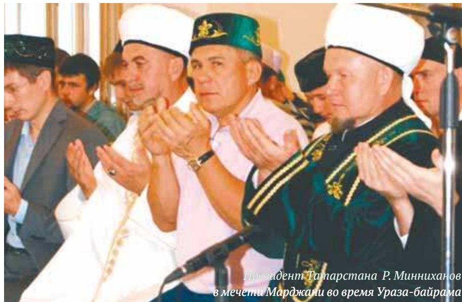
Президент Татарстана Р. Минниханов в мечети Марджани во время Ураза-байрама

При этом традиционно в пятничные и праздничные дни молитва выплескивается на улицы российских городов, доставляя неудобства для остальных горожан. Эту проблему нужно рассматривать разделив на две. Столпотворений у мечетей в пятничные дни можно и нужно избежать. Московская Соборная мечеть расширяется и по окончании реконструкции будет в состоянии вместить всех пришедших на джума-намаз, а в перспективе нужно будет строительство мечетей в остальных административных округах, тогда протяженные ряды молящихся, расположившихся на тротуарах, не будут смущать население.