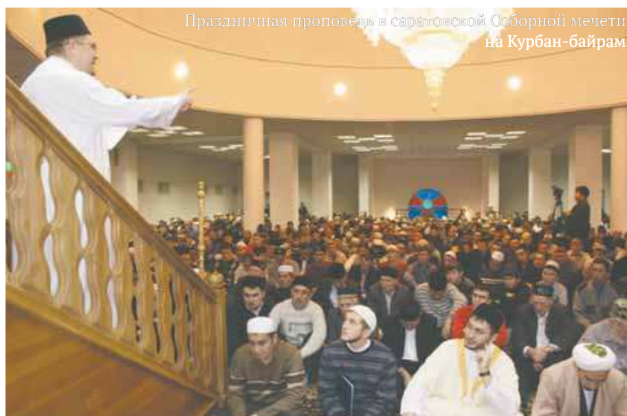
Праздничная проповедь в саратовской Соборной мечети на Курбан-байрам

На примере Саратовской области мы видим, как мусульманские