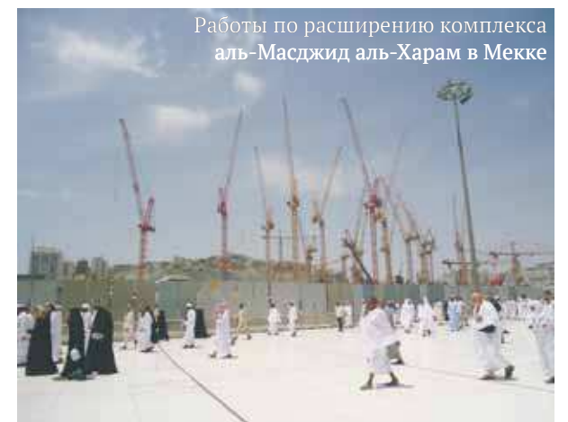
Работы по расширению комплекса аль-Масджид аль-Харам в Мекке

Власти и религиозные деятели, имамы и улемы Саудовской Аравии, да и всего мира с пониманием относятся к тому, что есть необходимость расширения мечети и увеличения территории для удобства паломникам и возможности совершить большему количеству мусульман и хаджа, и умры через изменение проекта мечети. Более того, исторические стены и столбы должны будут вынести за территорию уже новой, расширенной мечети, тем самым сохранив память.