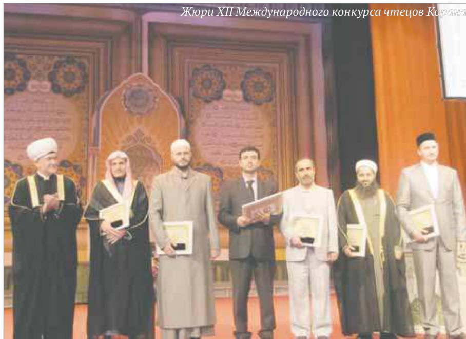
Жюри XII Международного конкурса чтецов Корана

В Коране сказано: «Воистину, те, которые читают Писание Аллаха, совершают молитву и расходуют из того, чем Мы наделили их, тайно и открыто, надеются на сделку, которая не окажется безуспешной, дабы Он вознаградил их сполна и даже добавил от Своей милости. Воистину, Аллах — Прощающий, Благодарный», — то есть чтение Корана само по себе является богослужением и ценится наравне