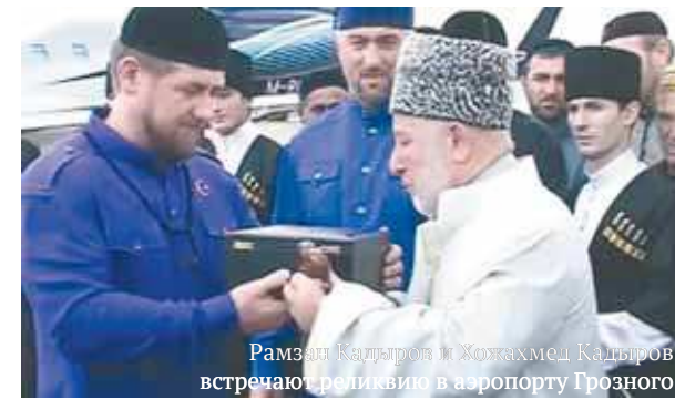
Рамзан Кадыров и Хожамед Кадыров встречают реликвию в аэропорту Грозного

22 сентября в Грозный из Лондона прибыла чаша Пророка Мухаммада (мир ему) — его чаша. В аэропорту реликвию встретил глава Чеченской Республики Рамзан Кадыров. Кроме того, вместе с чашей доставлено два ковра, которыми длительное время была покрыта могила Пророка (мир ему). Реликвии будут вечно храниться в Чечне. Они подарены российским мусульманам потомками Пророка.