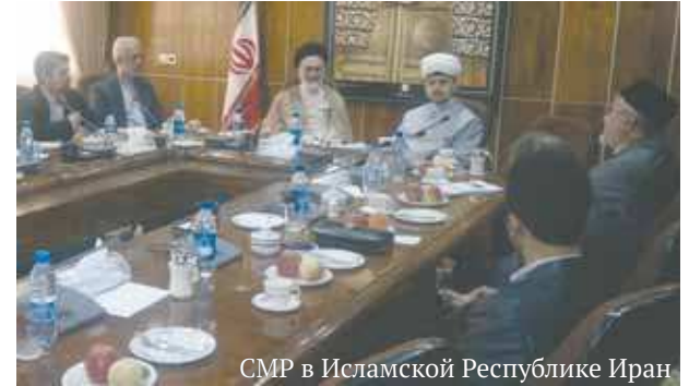
СМР в Исламской Республике Иран

Делегация СМР приняла участие в Международном форуме исламского пробуждения в Тегеране. На форуме принято решение о создании Движения исламского пробуждения, в руководящий орган которого предложено включить одного члена из России.